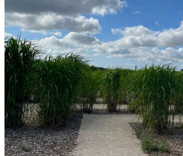
L'association des JDE et ses membres